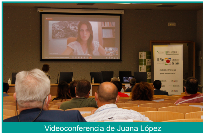
Videoconferencia de Juana López

Seguidamente, la directora general de Políticas contra la Despoblación del Ministerio para la Transición Ecológica y el Reto Demográfico, Juana López, dio a conocer a los asistentes al curso, mediante videoconferencia, las políticas contra la Despoblación que se están llevando a cabo desde el Gobierno de España.