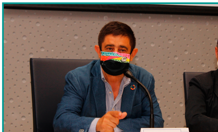
Francisco Reyes, presidente de la Diputación de Jaén

Para paliar esta situación, la Unión Europea acordó, en julio de 2020, la puesta en marcha de un instrumento para la recuperación de los países integrantes de la UE, los fondos Next Generation , que cuentan con una dotación de 750.000 millones euros, que se financiará mediante la emisión de deuda pública por parte de la UE, es decir, deuda mutualizada de la que serán corresponsables los